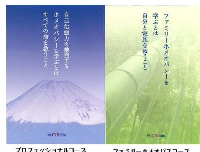
プロフェッショナルコース